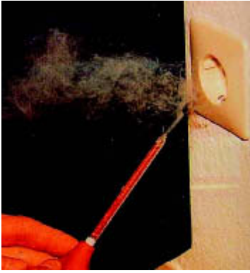
Undichte Elektroinstallation, visualisiert mit einem Strömungsprüfröhrchen.

luftdichter Anschluss hergestellt werden kann.