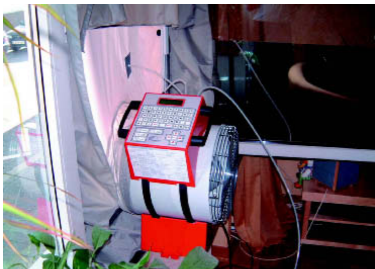
Messung der Luftdichtheit mit dem Blower-Door-Test eingebaut in ein Wohnzimmerfenster

Das Dilemma ist jedoch, dass bei Einhaltung des maximal zulässigen Luftwechsels der Mindestluftwechsel nicht mehr sichergestellt ist. Je nach Wetterla-