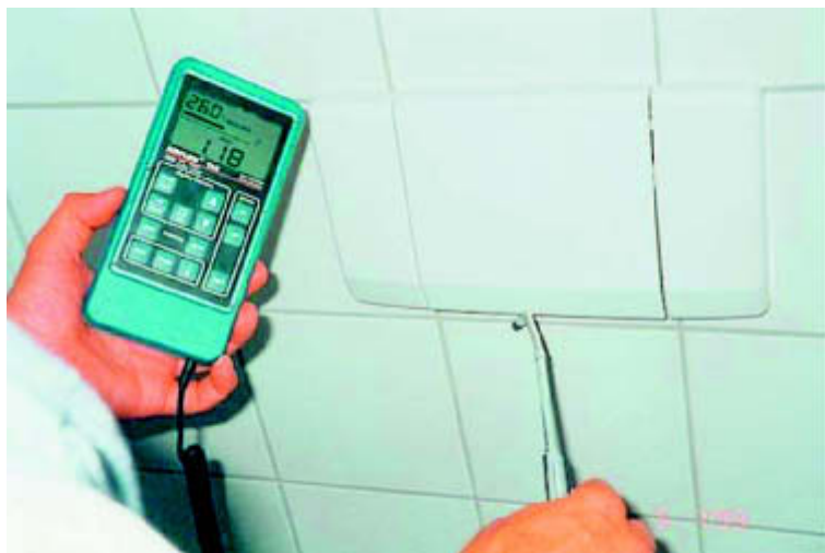
Zugerscheinungen im Bereich eines Spülkastens bei Vorwandinstallation.

Die haustechnisch nicht zu vermeidenden Durchdringungen können z.B. durch eine Installationsebene zwischen gemauerter Außenwand mit Innenputz und vorgesetzter Innenschale luftdicht ausgeführt werden. Ansonsten ist in den Planungsunterlagen der Hersteller luftdichter Folien und Pappen beschrieben, wie mit Hilfe eines Papp- oder Folienkragens ein