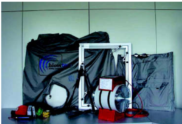
Blower-Door Modell LTM blowtest 3000 mit Zubehör

Die Ursachen sind: Thermischer Auftrieb und äußerer Winddruck. Warme Luft steigt durch thermischen Auftrieb nach oben und entweicht somit aus Fugen und Ritzen. Äußerer