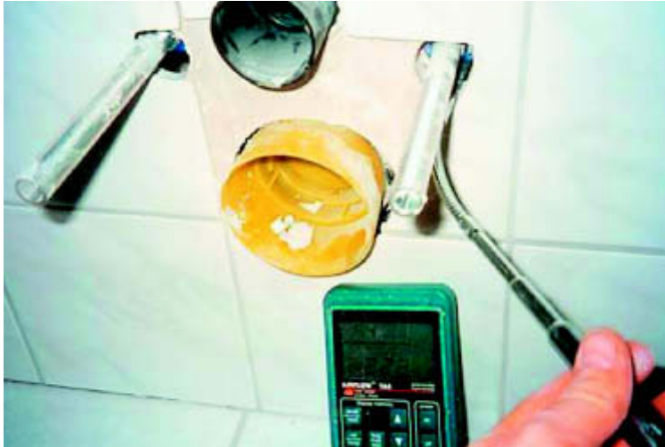
Beispiel einer Vorwandinstallation mit fehlendem Dichtheitskonzept.