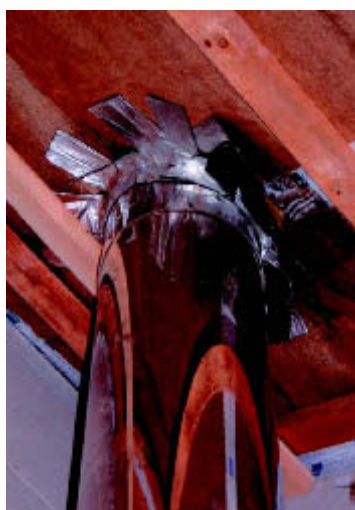
Beispiel einer schlechten handwerklichen Ausführung durch falsche Klebebänder

ge kann die Luftwechselrate unter 0,1 1/h abfallen. Auf diese Problematik wurde bereits in der IKZ-Ausgabe 12/96 [3] hingewiesen. Hier ein Auszug aus der Zusammenfassung: „Weder bei Anlage nach DIN 18017, noch bei Fensterlüftung, sind die nach DIN 1946 Teil 6 und DIN 18017 geforderten Volumenströme zu erzielen. Daraus ist abzuleiten, dass der hygienisch notwendige Luftwechsel nicht mehr gewährleistet ist und damit die anerkannten Regeln der Technik nicht eingehalten werden können. Das Resultat sind Mängel, die zu Ansprüchen der Kunden führen werden, z.B. Feuchteschäden durch mangelnde Lüftungsanlagen. Für Planer und ausführende Firmen besteht nach dem Regelwerk zumindest eine Informationspflicht, um werksvertraglich einwandfrei tätig sein zu können.“