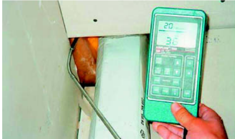
Aufspüren und Orten von Leckagen mit dem Thermoanemometer, bei mangelhaft ausgeführter Durchdringung der Luftdichtheitsebene.

Gebäude ohne Lüftungsanlage geplant sind bzw. so ausgeführt werden sollen.“ [4]