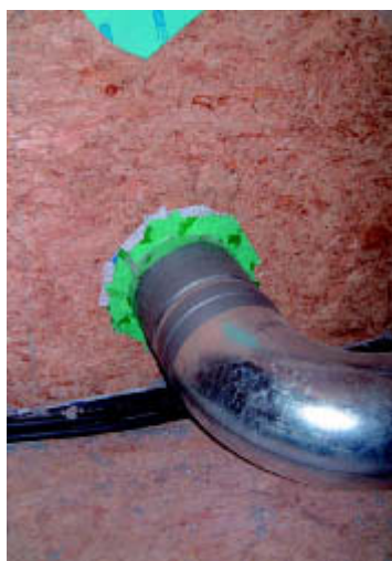
Beispiel einer dauerhaft dicht ausgeführten Abklebung einer Rohrdurchführung