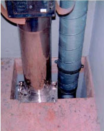
Rohrdurchführungen durch eine Geschossdecke mit fehlendem Dichtheitskonzept.